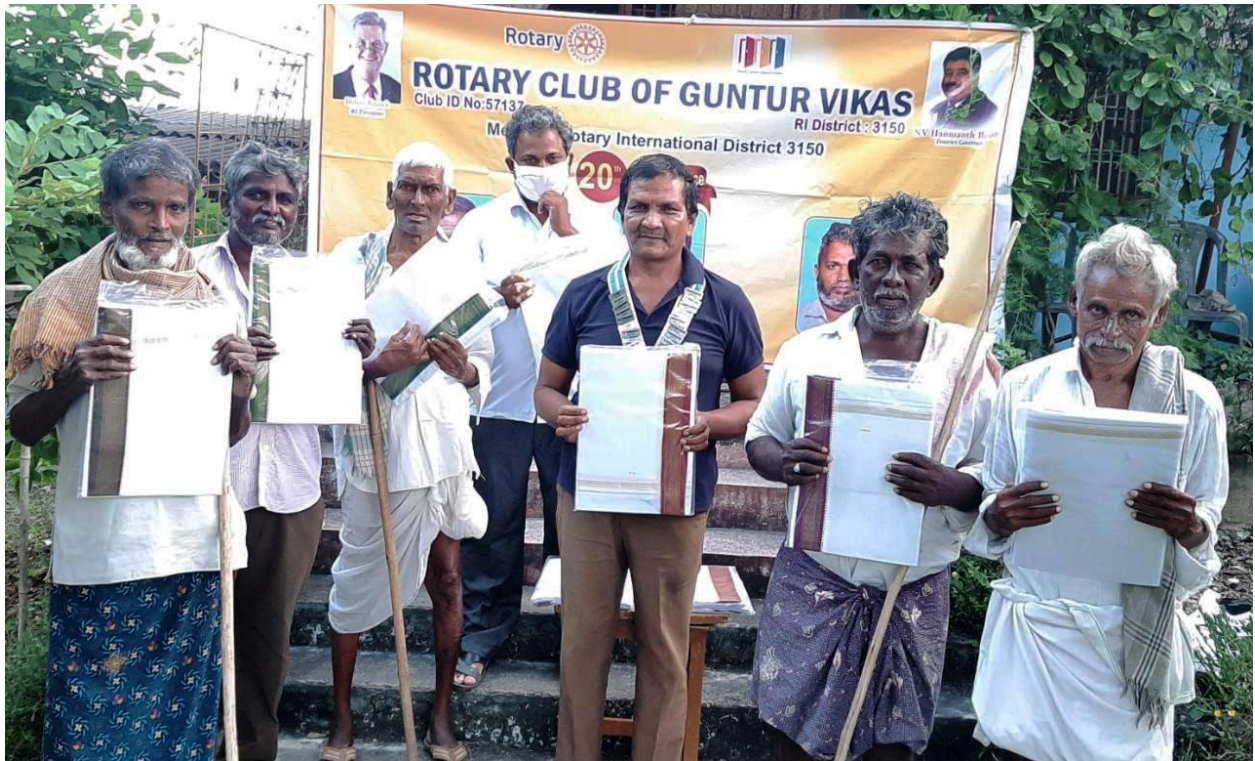
Donated new clothes to poor old aged people on 9th November, 2020